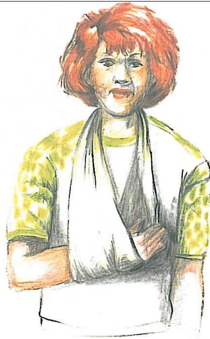
Figuur 4.20 Draagdas

80 % van de handeling moet aangetoond zijn.